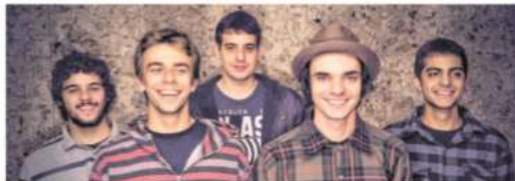
Grupo formado por amigos de infância toca no On The Road a partir das 23h: 'caldeirão'

O On The Road fica na rua Antônio Alves, 31-64. Informações: (14) 3227-5621.